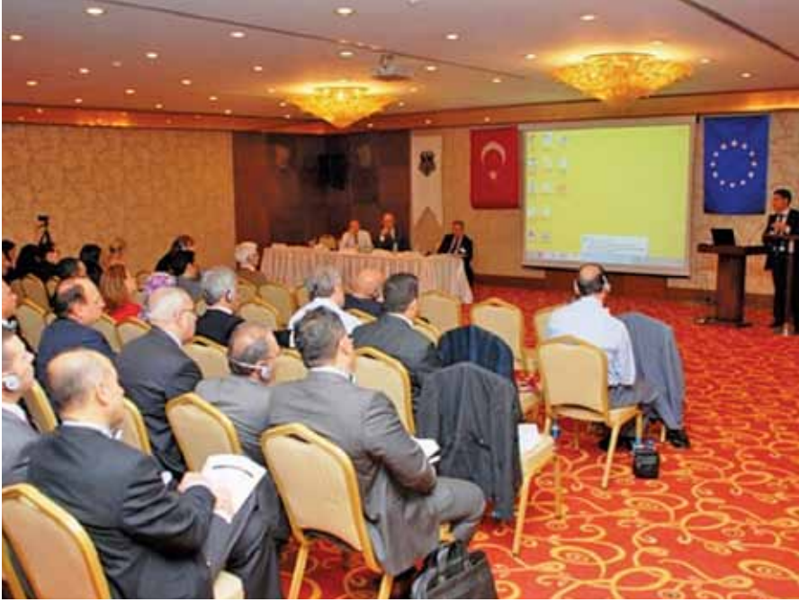
Adalet Bakanlığı Ceza ve Tevkif Evleri Genel Müdürlüğünün faydalanıcısı olduğu “Cezaevi Kapasite Yönetimi Çalıştayı”