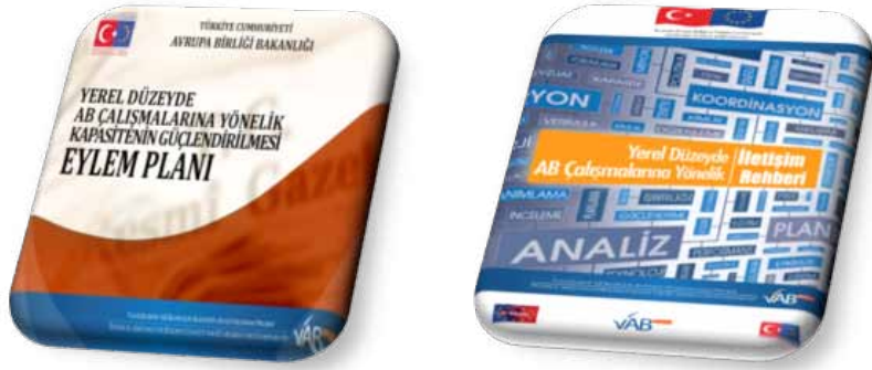
Yerel Düzeyde AB Çalışmalarına Yönelik Kapasitenin Güçlendirilmesi Eylem Planı ve Yerel Düzeyde AB Çalışmalarına Yönelik İletişim Rehberi