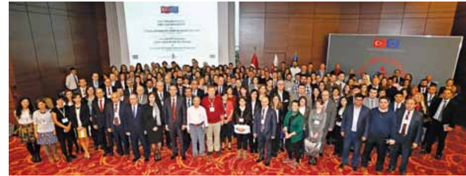
Sivil Toplum Diyalogu Projesi Hibe Uygulama Eğitimi ve Açılış Etkinliği 11-13 Kasım 2014, Ankara

AB ve Türkiye Arasında Sivil Toplum Diyalogu III Programı’nın diğ er bir bölümünü oluşturan Diyalog Seminerleri Bileşeni kapsamında ise, Türkiye-AB ilişkilerinde toplumların birbirlerine yönelik algılarının ve karşılıklı anlayışın artırılmasında etkin bir rol oynayan STK’lar, kamuoyunun görüşlerini şekillendiren medya ve katılım sürecinin temel aktörleri olan kamu personeli arasındaki etkileşimi ve işbirliğini artıracak bir iletişim ağı kurulmasına destek olacak bir dizi çalışma gerçekleştirilmektedir. Bu doğrultuda, diyalog seminerleri 2015 yılının ilk yarısında Antalya, İstanbul ve Gaziantep illerinde düzenlenmiş olup önümüzdeki dönemde ise Samsun, Konya ve İzmir illerinde düzenlenecektir. Öte yandan, seminerlerin ardından gerçekleştirilecek çalıştaylar ve çalışma ziyaretiyle Türkiye-AB arasında kurulmuş olan diyalog köprüsü daha da sağlamlaştırılacaktır.