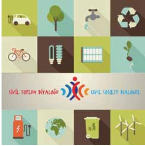
AB ve Türkiye Arasında Sivil Toplum Diyalogu IV Projesi

2015 yılı ilk çeyreğinde duyurulmuş olan ve Sivil Toplum Diyalogu Projelerinin devamı niteliğindeki "AB ve Türkiye Arasında Sivil Toplum Diyalogu IV Programı" ile "AB Müktesebatı" başlıklarından oluşan 9 öncelikli alanda Türkiye ve AB üye ülkelerindeki sivil toplum kuruluşları tarafından geliştirilecek tahmini 75 projeye yaklaşık 11 milyon avro hibe desteği sağlanması öngörülmektedir.